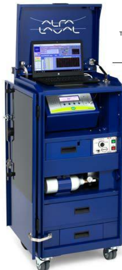
Test de integridad de Alfa Laval