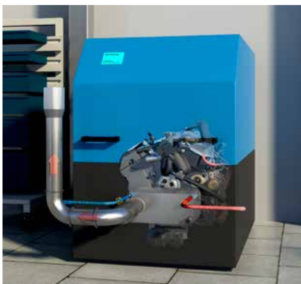
Kogeneracja ciepła i energii elektrycznej

Wymienniki ciepła Alfa Laval stosowane do odzysku ciepła zapewniają szybki zwrot inwestycji oraz ogromne korzyści dla środowiska. W przypadku zastosowań niskociśnieniowych połączenie wysokiej wydajności z niskim spadkiem ciśnienia często zapewnia zwrot inwestycji w ciągu jednego roku.