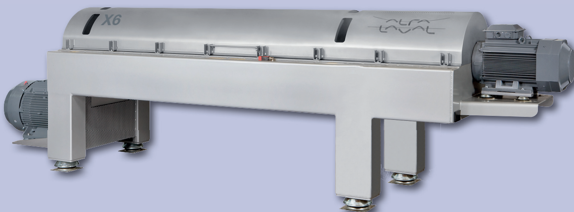
Φυγοκεντρικός Διαχωριστήρας - Decanter X6

Φυγοκεντρικοί Διαχωριστήρες - Decanter υψηλής απόδοσης X4, X6, X7 και X9