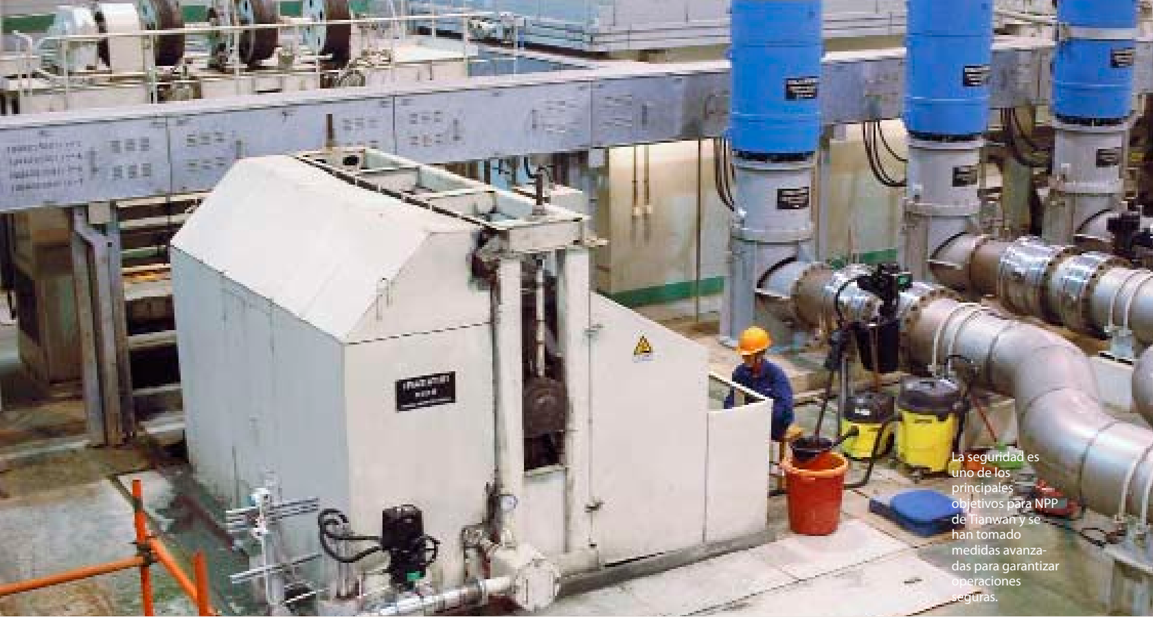
La seguridad es uno de los principales objetivos para NPP de Tianwan y se han tomado medidas avanzadas para garantizar operaciones seguras.