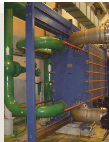
NPP de Tianwan utiliza en total 46 intercambiadores de calor de placas con juntas de Alfa Laval.

“Las ventajas de los productos de Alfa Laval no sólo consisten en la alta calidad que ofrecen, sino también en sus diseños orientados al servicio”, dice Yan.