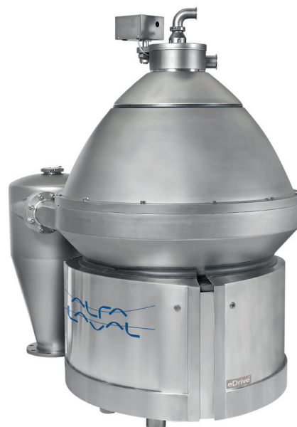
Wirówka wysokoobrotowa z bezpośrednim napędem.