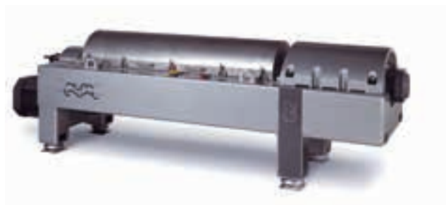
デカンター遠心分離機

デカンター型遠心分離機は、製品原料や比較的高濃度のバイオ系排水の脱水や清澄用に設計されています。分離された固形物はローターとは違う回転速度で回転する内部スクリーコンベヤで連続的に排出されます。デカンター型遠心分離機は、ディスク型遠心分離機と比較して固形物をより脱水した状態で提供し、プレート式やフレーム式フィルターよりも省力化が図れ、閉塞の問題は生じません。