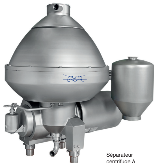
Séparateur centrifuge à entraînement par engrenage